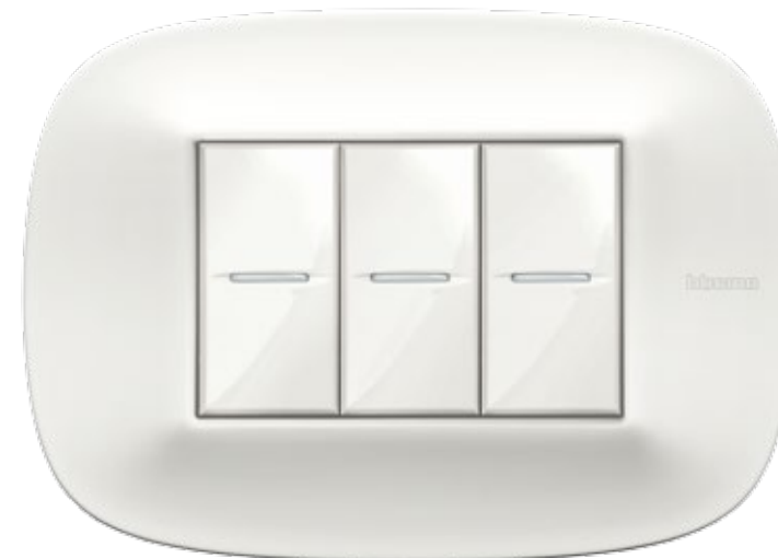
WHITE - HD