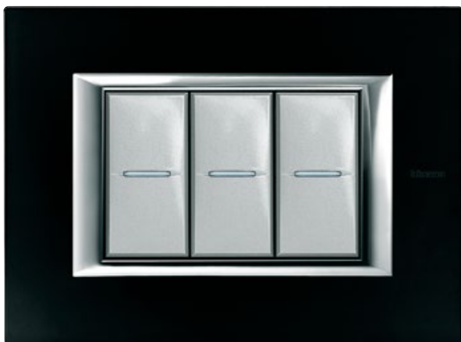
BLACK GLASS - VNN