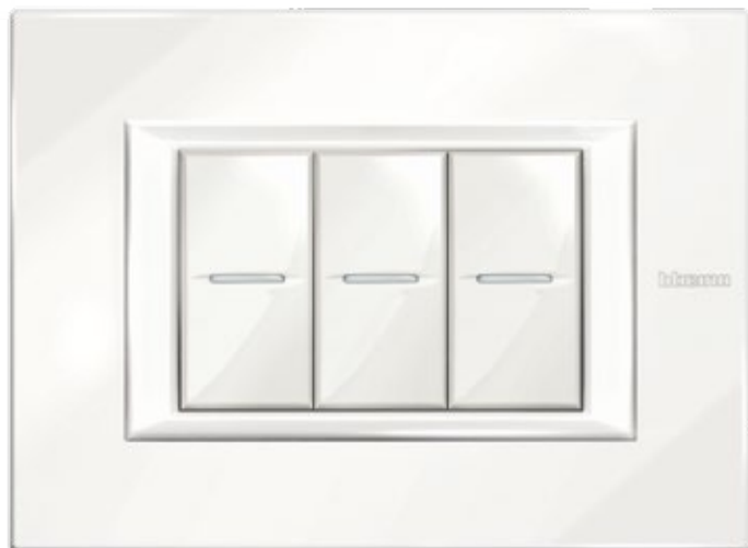
WHITE - HD