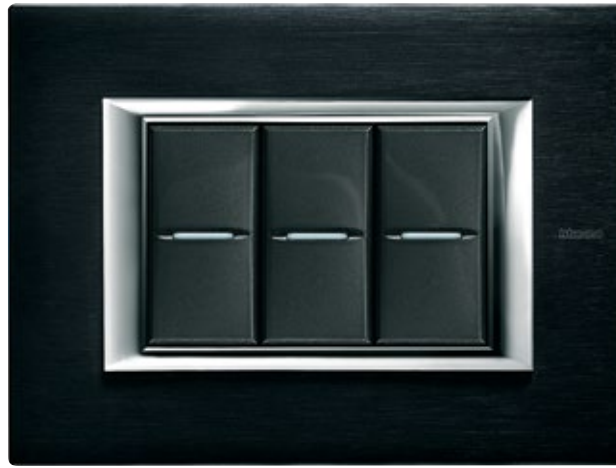
BRUSHED ANTHRACITE - XS