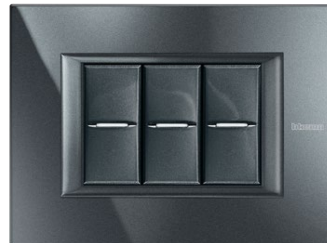
GRAPHITE - HS