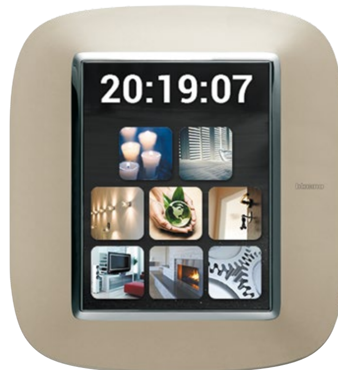
ΟΘΟΝΗ ΑΦΗΣ 3,5" ΠΛΑΙΣΙΟ LIGHT TITANIUM