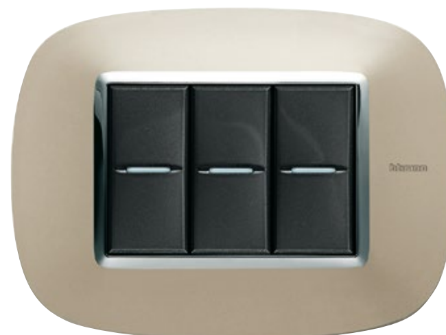
LIGHT TITANIUM - TC

Λάμψη και πολυτέλεια. Η επιθυμία μου για ένα λαμπερό αποτέλεσμα.