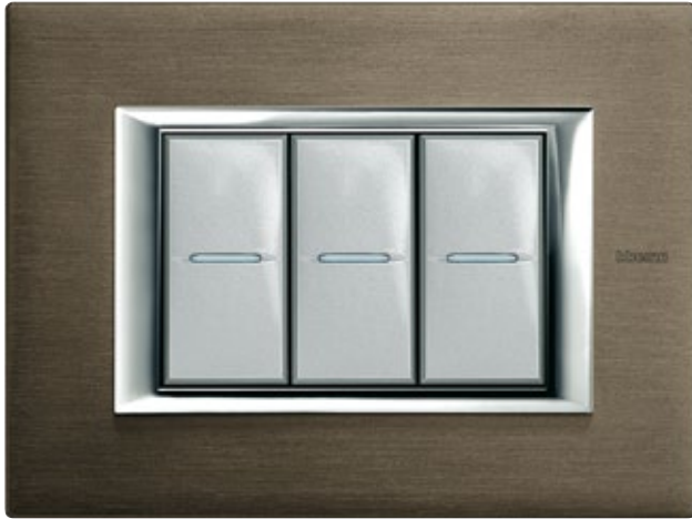
BRUSHED BRONZE - BR

Μεταλλική λάμψη και αρμονία. Η επιθυμία μου για σύγχρονο design.