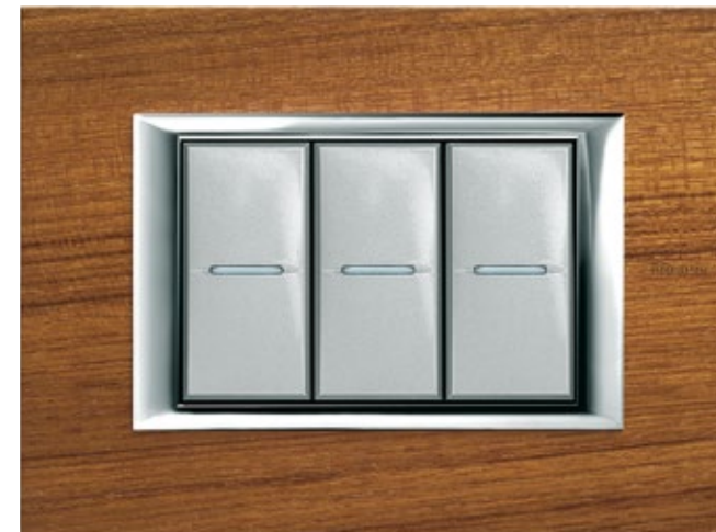
TEAK - LTK

Φυσική ομορφιά και ζεστασιά του ξύλου. Η επιθυμία μου για διαχρονικό στυλ.