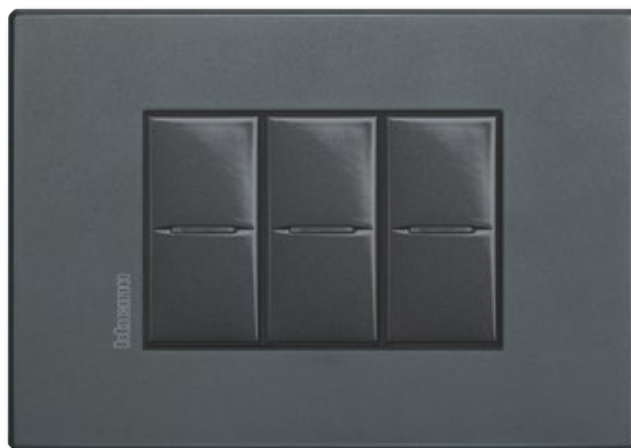
ECLIPSE - XN