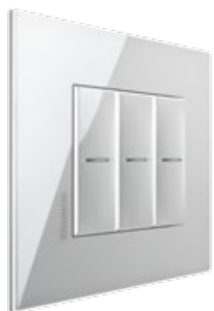
TECH - HC