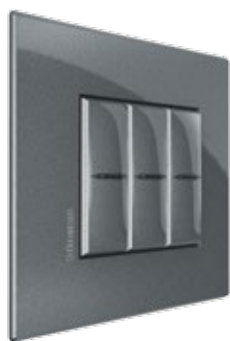
GRAPHITE - HS