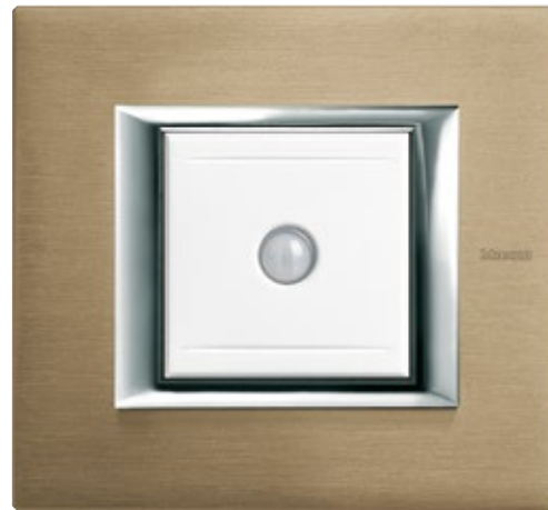
ΔΙΑΚΟΠΤΗΣ ΕΞΟΙΚΟΝΟΜΗΣΗΣ ΕΝΕΡΓΕΙΑΣ ΠΛΑΙΣΙΟ BRUSHED TITANIUM