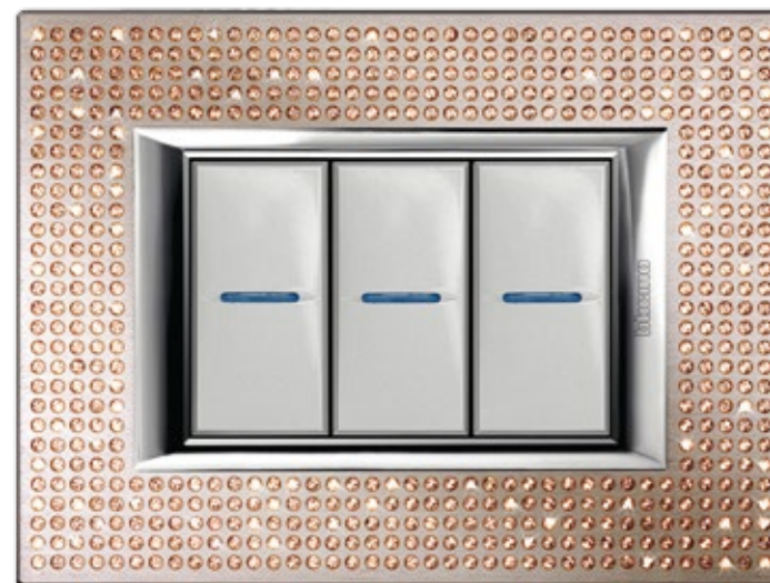
LIGHT PEACH - SWL

ΕΙΔΙΚΑ ΠΛΑΙΣΙΑ ΜΕ ΚΡΥΣΤΑΛΛΑ SWAROVSKI ELEMENTS*