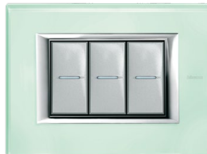
KRISTALL GLASS - VKA