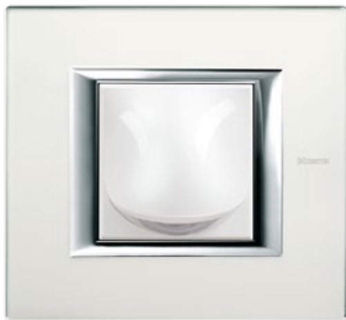
ΦΩΤΙΣΤΙΚΟ ΟΔΕΥΣΗΣ ΠΛΑΙΣΙΟ MIRROR GLASS