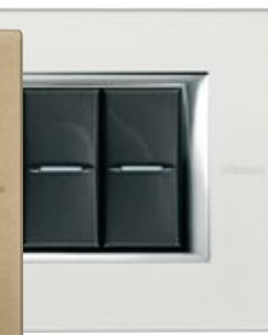
SILVER - SAN