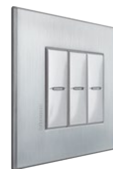
CHROME - CRS