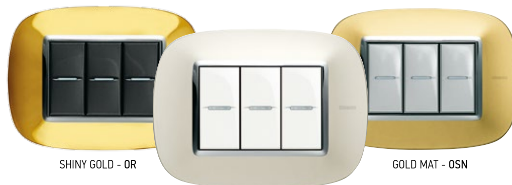
SHINY GOLD - OR