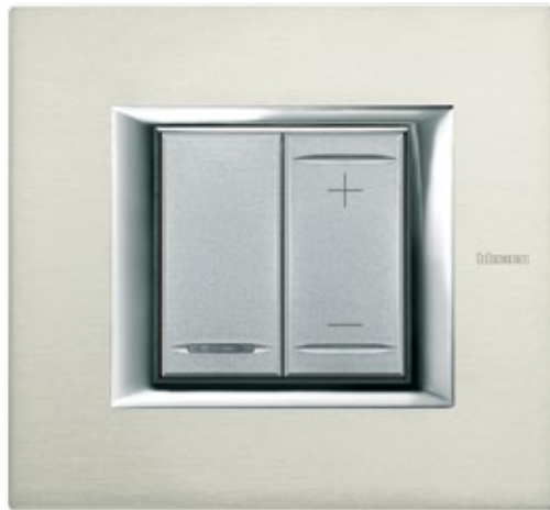
ΕΚΟ ΡΥΘΜΙΣΤΗΣ ΦΩΤΙΣΜΟΥ ΠΛΑΙΣΙΟ BRUSHED ALUMINIUM

ΥΠΕΡΟΧΗ ΑΙΣΘΗΣΗ ΥΨΗΛΗΣ ΤΕΧΝΟΛΟΓΙΑΣ ΚΑΙ DESIGN Η επιθυμία μου να συνδυάζω την υψηλή τεχνολογία με το κομψό φινιρίσμα.