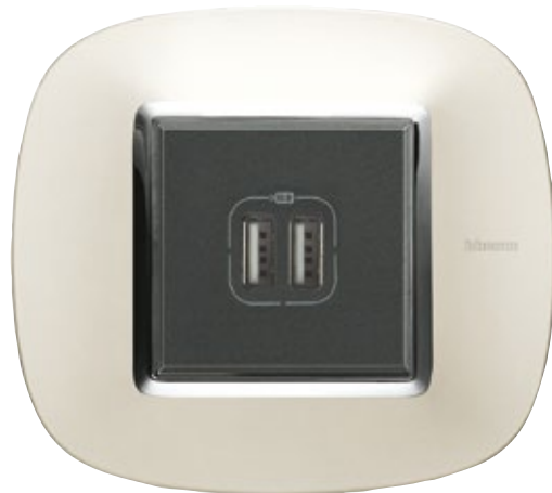
ΠΡΙΖΑ ΦΟΡΤΙΣΗΣ 2 USB ΠΛΑΙΣΙΟ SILVER MAT