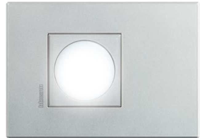
ΑΠΟΣΠΩΜΕΝΟ ΦΩΤΙΣΤΙΚΟ ΑΣΦΑΛΕΙΑΣ ΠΛΑΙΣΙΟ AXOLUTE AIR CHROME