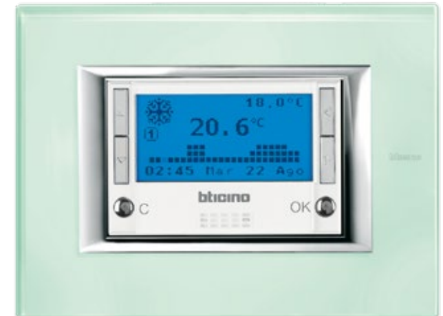
ΘΕΡΜΟΣΤΑΤΗΣ ΠΛΑΙΣΙΟ KRISTALL GLASS