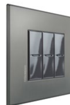
NICKEL - NIS