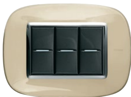
LIQUID IVORY - DA