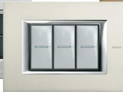
BRUSHED ALUMINIUM - XC