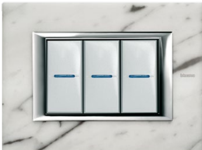
CARRARA MARBLE - RMC