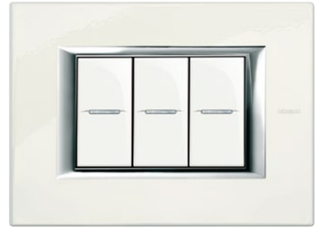
WHITE LIMOGES - BG