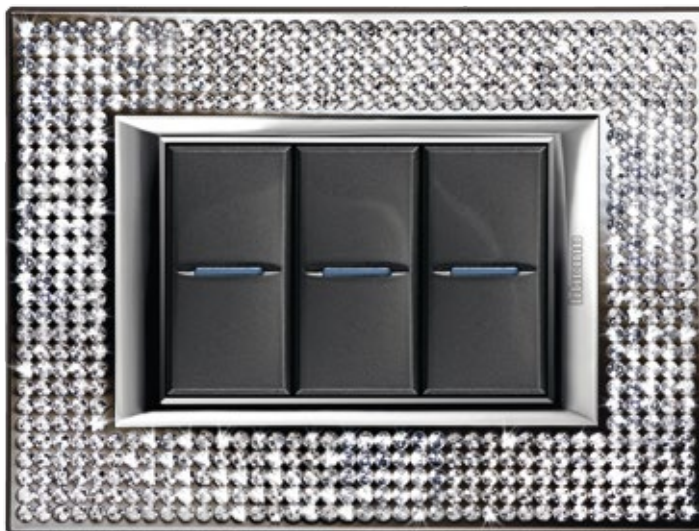
CRYSTAL - SWC