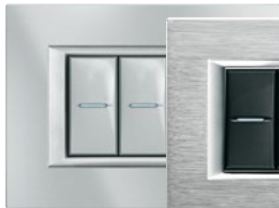
TECH - HC