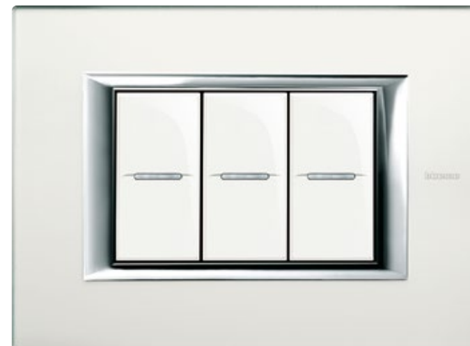
MIRROR GLASS - VSA