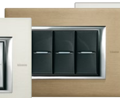
BRUSHED TITANIUM - NX