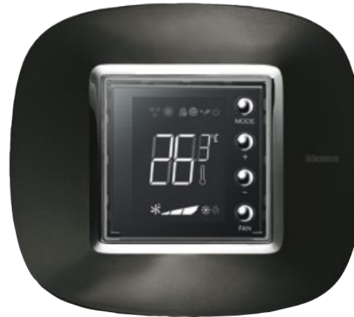
ΨΗΦΙΑΚΟΣ ΘΕΡΜΟΣΤΑΤΗΣ ΠΛΑΙΣΙΟ ANTHRACITE