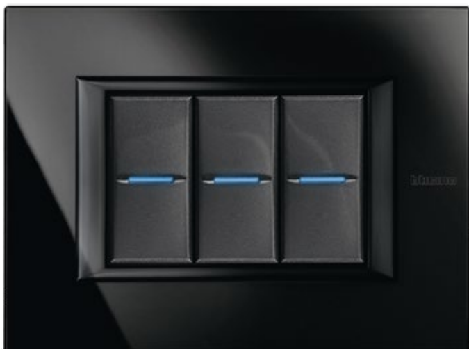
NIGHTER - VNB