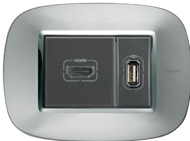
ΠΡΙΖΑ HDMI ΚΑΙ ΠΡΙΖΑ ΠΛΗΡΟΦΟΡΙΚΗΣ USB ΠΛΑΙΣΙΟ ALUMINIUM