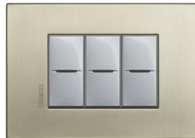
TITANIUM - TIS