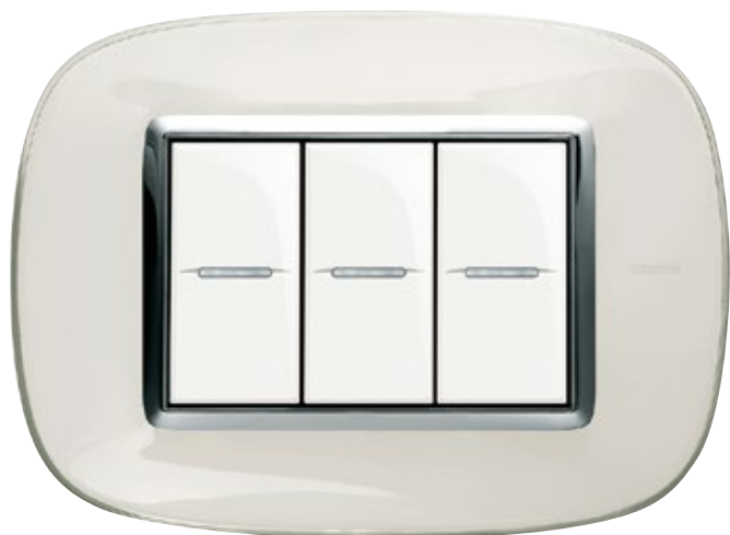
LIQUID WHITE - DB

Ιριδισμός του νερού. Η επιθυμία μου για ανάλαφρη αίσθηση.