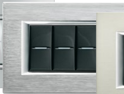
BRUSHED CHROME - CR