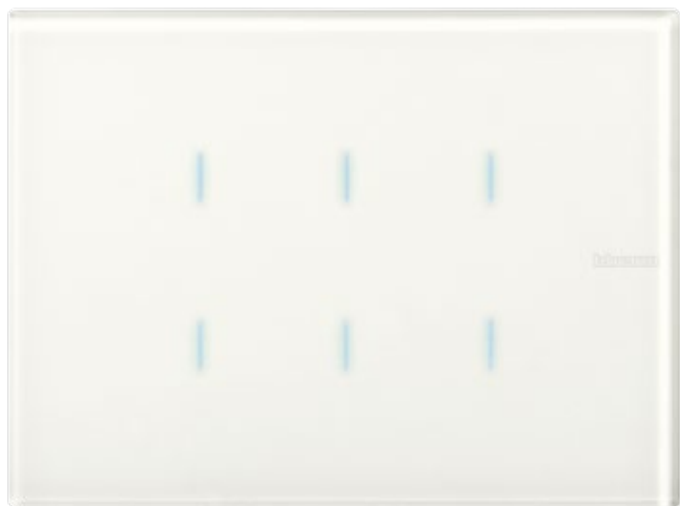
ΜΗΧΑΝΙΣΜΟΣ ΕΛΕΓΧΟΥ ΑΦΗΣ WHITE

Λευκό σε κάθε λεπτομέρεια. Η επιθυμία μου για αρμονία και “καθαρή” τελειότητα.