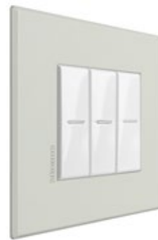
SAND - SB