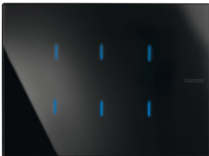
ΜΗΧΑΝΙΣΜΟΣ ΕΛΕΓΧΟΥ ΑΦΗΣ NIGHTER

Η επιθυμία μου για τολμηρή έκφραση του στυλ.