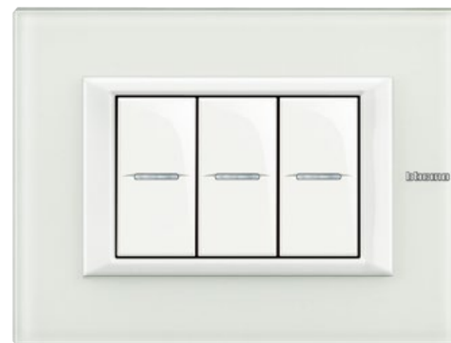
WHITE GLASS - VBB