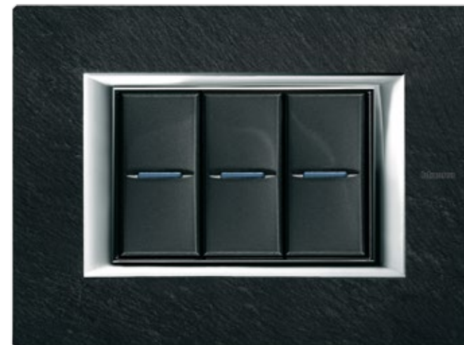
SLATE - RLV

Αυθεντικό μάρμαρο και σχιστόλιθος. Η επιθυμία μου για υλικά που προσδίδουν κύρος στο χώρο.