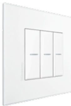
WHITE MAT - AW