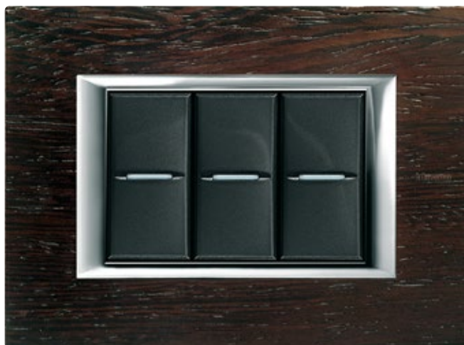
WENGE - LWE